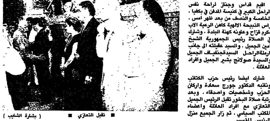
شارك أيضا رئيس حزب الكتائب ونائبه الدكتور جورج سعادة واركحل الحزب وشخصيات واسعة